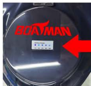
⑤ pevně zavřete otvor na baterii

po zapnutí světelný indikátor zobrazuje její stav