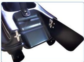
① Otevřená zadní komora

Zadní komora: Dvířka zadní komory musí být zavírána manuálně pomocí háčku. Součástí balení je náhradní háček.