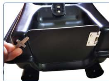
③ Otočte háčkem doprava