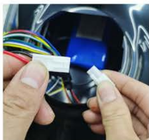
② spojte baterii s PCB deskou