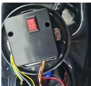
④ zapněte baterii