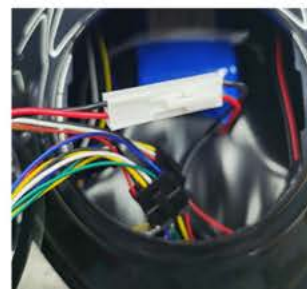
③ ujistěte se, že spojené části drží