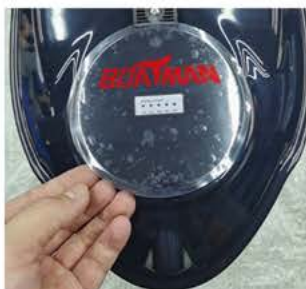
① otevřete otvor na baterii

Otvor na baterii se nachází v přední části lodičky. Baterii je potřeba vyjmout při každém nabíjení. Složení baterie viz obrázky: