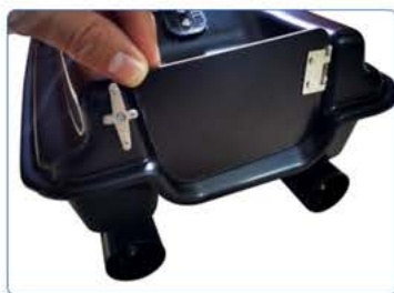
② Zavřete dvířka komory